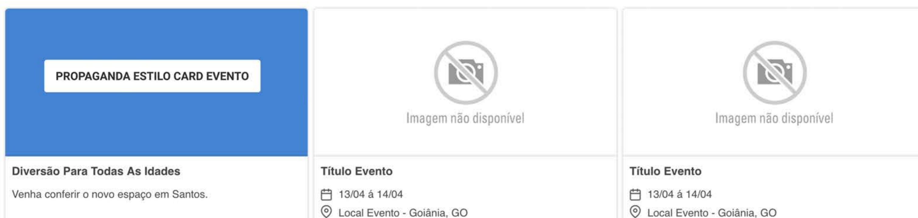
Exemplo de sistema utilizando um banner de card eventos

Encontre um evento com toda a facilidade que você precisa