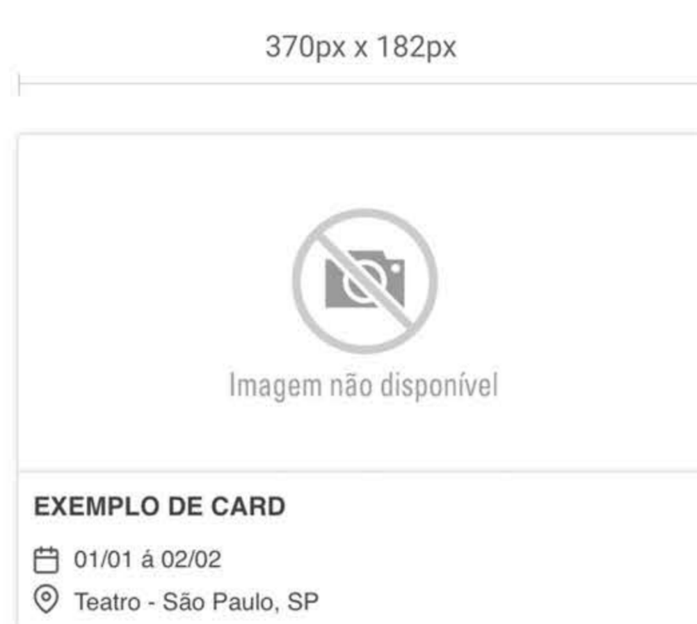
Imagem para propagandas

O sistema permite a utilização de dois tipos de propaganda, no estilo banner e no estilo card de eventos .